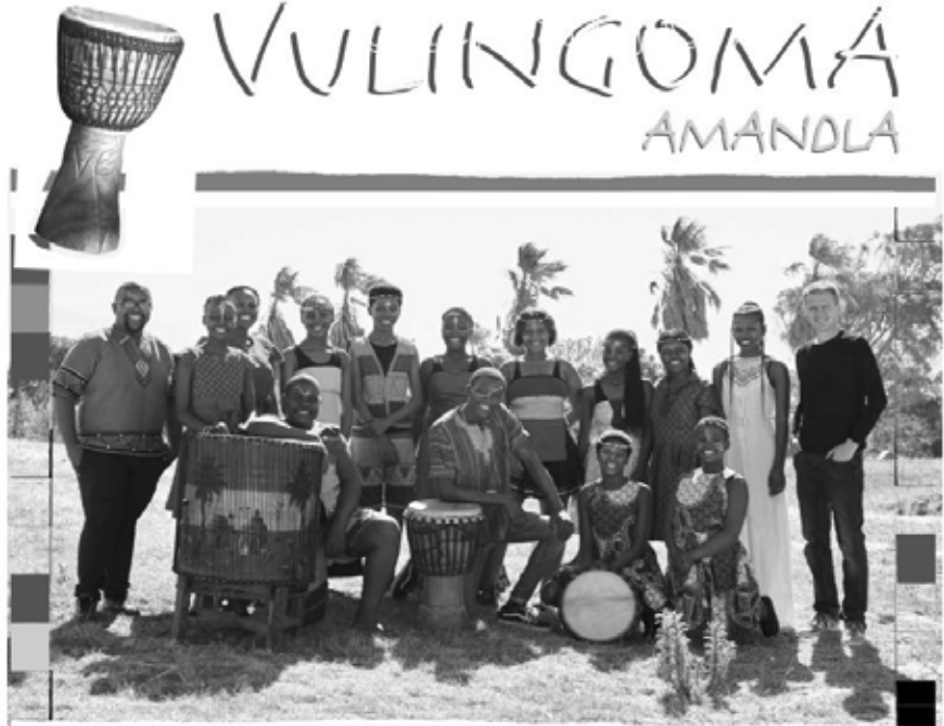
Ein Stück afrikanische Kultur: Gesungen und getanzt von Jugendlichen aus dem Kinderhilfsprojekt VULAMASANGO in Kapstadt.